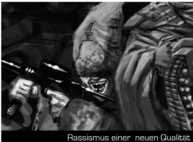
Rassismus einer neuen Qualität

Sie spielen auf die „Elfenrente ab 100“ bzw. die „Verminderte Haftlänge für Orks“ an? Unter anderem. Diese